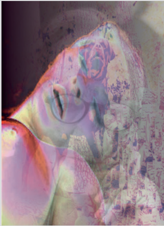
Drei Überblendungen aus der Selbstporträt-Fotoserie: «coronaselfies I-III / 2020 Eine Porträtauswahl mit Begleittext 30x21cm / Digitalprint